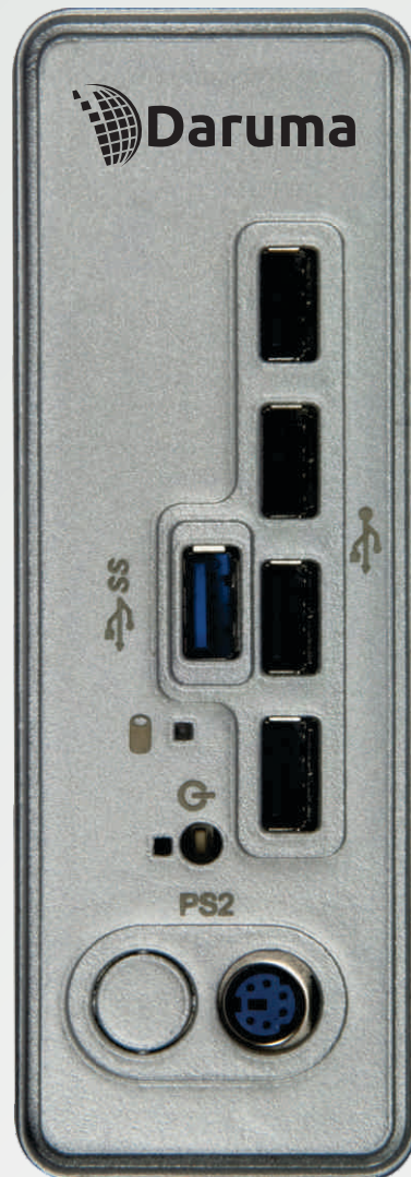
imagem frente - MT1400 - tamanho real

Sua concepção permite obter o máximo do produto a um custo competitivo, configurando-o conforme as aplicações e necessidades de uso. Podem ser configurados como thin client para uso em soluções de arquitetura de rede cliente/sevidor na qual os processamentos são realizados no próprio servidor.